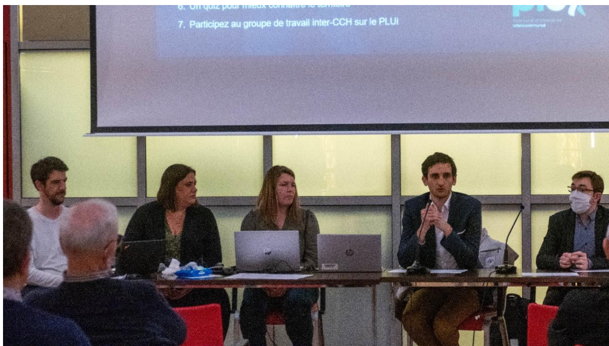
Illustration de la rencontre PLUi interCCH de Besançon – avril 2022

Nb. La partie « Préserver et se divertir » n'a pu être traitée faute de temps et pourra être abordée lors de la prochaine rencontre. Ces thématiques pourront être abordées également dans le groupe de travail PLUi Inter CCH.