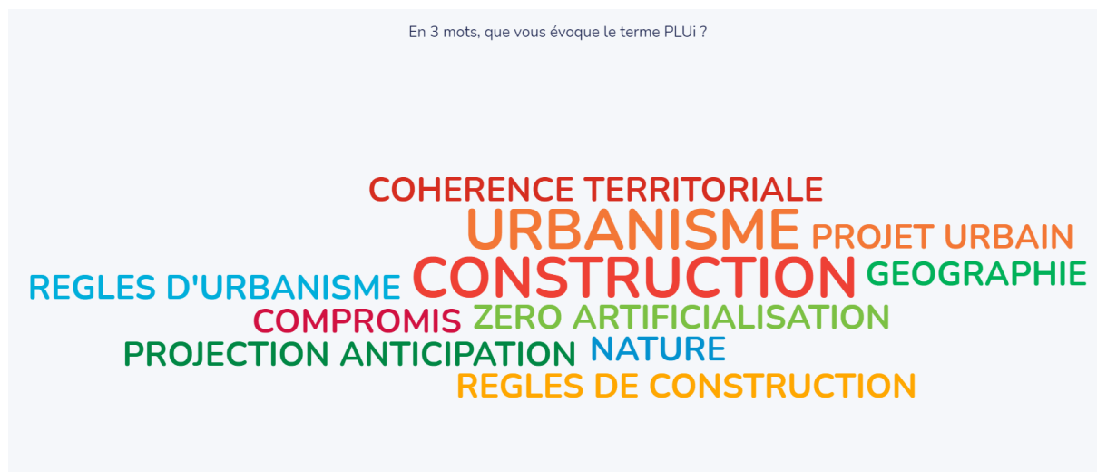
Illustration du nuage de mots formé par les participants « Qu'est ce que vous évoque le PLUi ? » - avril 2022

Avant tout apport d'information les participants ont été invités, en trois mots clés, à partager ce que leur évoque le terme PLUi :